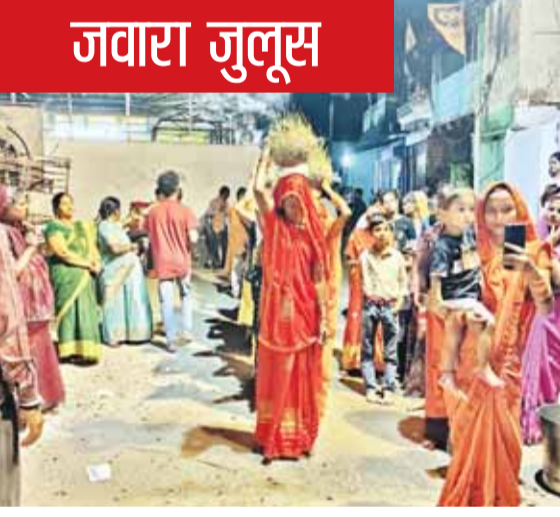
मझौली। चैत्र नवरात्रि: नवमी के दिन श्रद्धा भाव भक्ति से जवारे कलश का विसर्जन किया गया। नगर में रखे दिवालों में रखे हुए जवारे का विसर्जन नगर के मुख्यमार्ग से होते हुए नगर से लगे हुए दुर्गा घाट तालाब में सभी जवारा का विसर्जन किया गया।