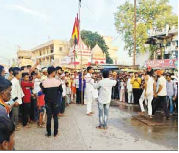
मझौली। चैत्र नवरात्रि: नवमी के दिन श्रद्धा भाव भक्ति से जवारे कलश का विसर्जन किया गया। नगर में रखे दिवालों में रखे हुए जवारे का विसर्जन नगर के मुख्यमार्ग से होते हुए नगर से लगे हुए दुर्गा घाट तालाब में सभी जवारा का विसर्जन किया गया।